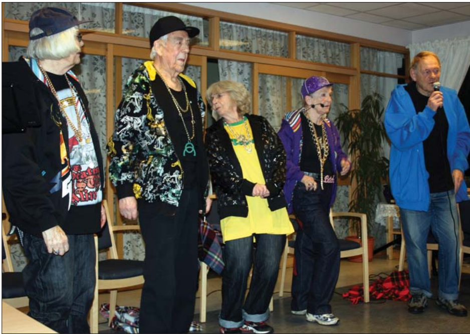
Cabaret Fossile, Røas stolthet, vakte som vanlig stor begeistring på årsmøtet.